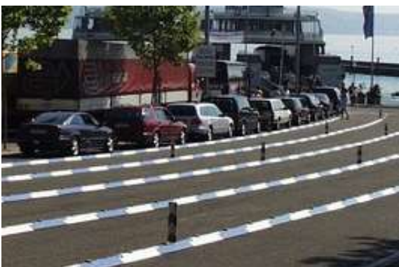
Exemple de couleur optionnelle : bleu et blanc (D'autres couleurs sont disponibles sur demande)