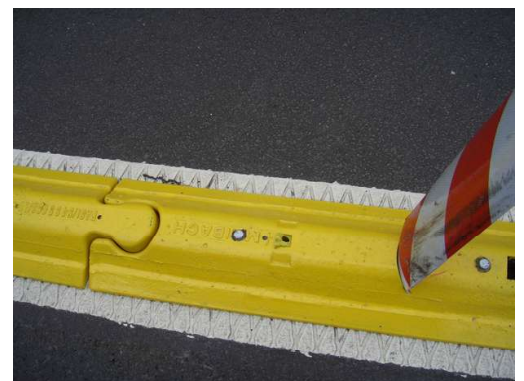
Des picots en caoutchouc assurent la traction pour une utilisation temporaire Pour une utilisation permanente, les éléments peuvent être vissés au sol.